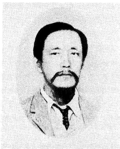
図3. 大久保三郎。明治27年（小倉謙編、1940から）

大久保三郎（図3）は安政4年（1857）5月23日、幕末に勝安房守らとともに徳川幕府のために奔走した幕臣、大久保一翁の子息として生まれた。父の大久保一翁は維新後、新政府に再び登用され、東京府知事などを勤め、子爵そして元老院議員になった（松岡英夫、1979）。三郎は明治4年（1871）米国に私費留学した。はじめニューブランズウィック（New Brunswick）のラトガーズ（Rutgers）大学で学んだのち（おそらく語学）、ミシガン（Michigan）大学アナバー（Ann Arbor）校で植物学を修め、さらに明治9年（1876）英国で植物学を学んだ。帰国後、明治11年